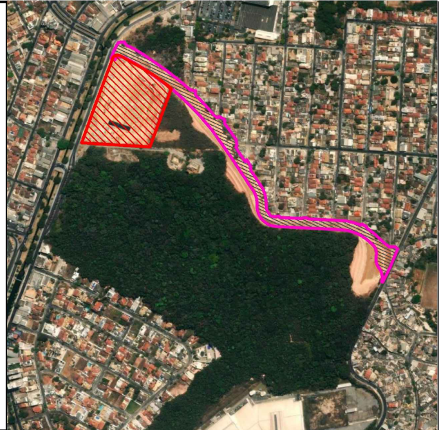
PLANTA DE SITUAÇÃO ESCALA: 1/10.000